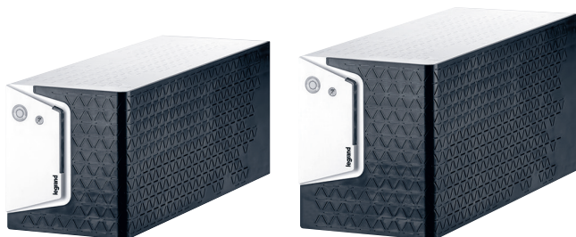
3 101 83